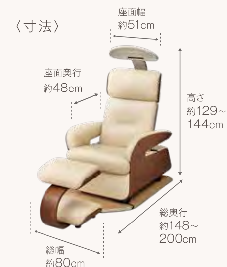
100th SPECIAL EDITION MODEL HEF-Jz12000M 仕様